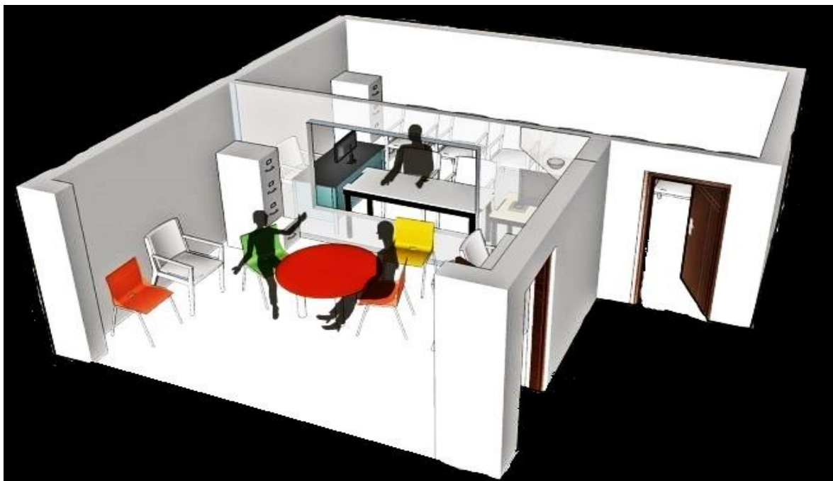
Ilustración de la diligencia de Cámara de Gesell

Nota: En la ilustración se puede ver una cómo se desarrolla la Cámara de Gesell, donde se vislumbra su estructura física y además la participación de la o el juzgador, mientras escucha la declaración de un menor, receptada por una psicóloga.